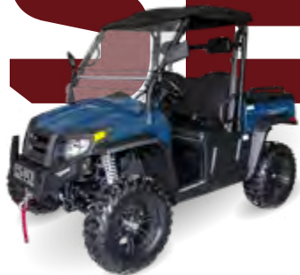
SECTOR HS7 Li