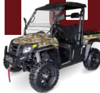
SECTOR HS15 Li

AC-Induktionsmotor 19 kW Spitzenleistung 140 Nm/6000 U/min 50 km/h Lithium-Ionen 14,7 kWh T3a/b & EPA 72 V On-Board-Ladegerät 6-8 Stunden 80 km